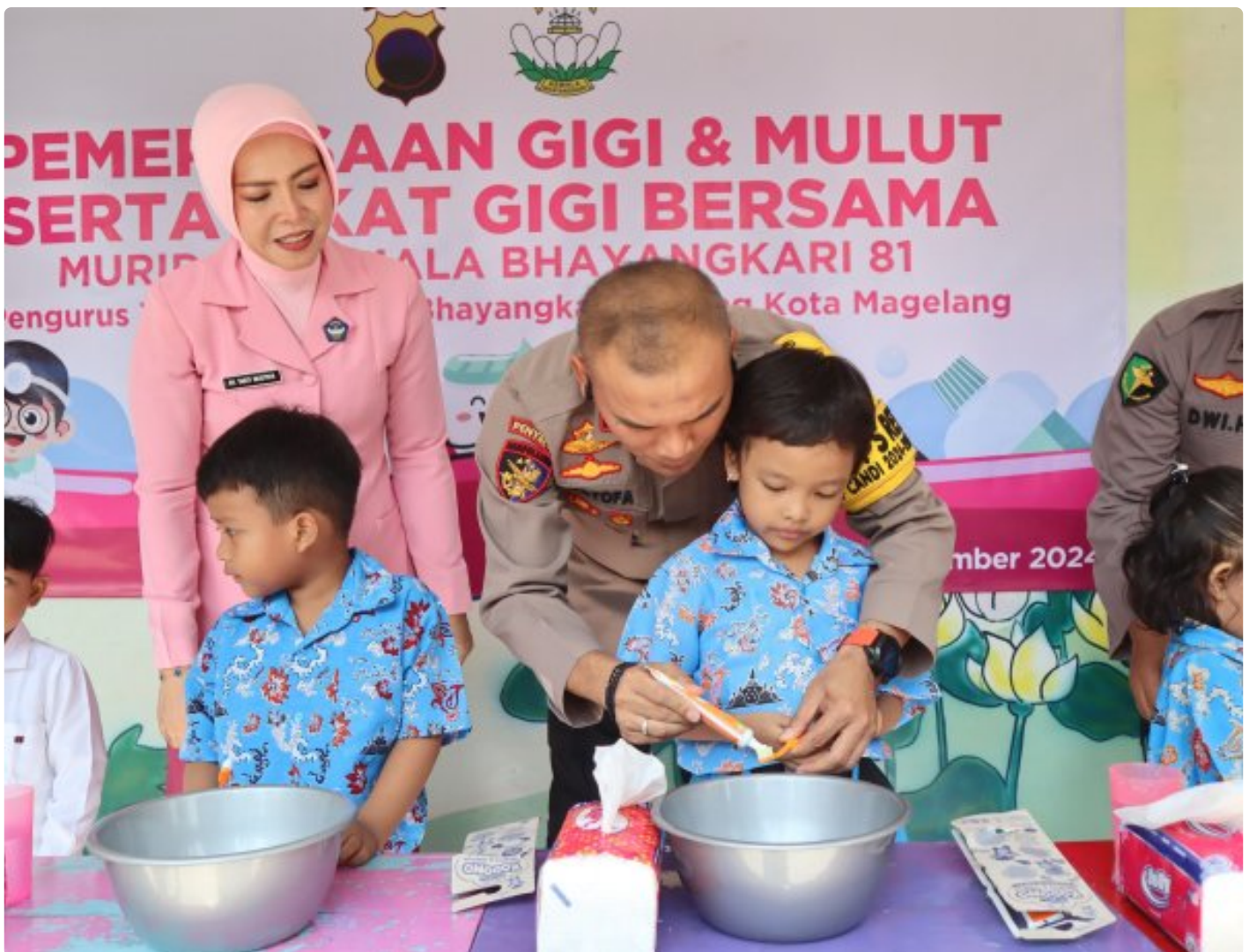
Foto: Bhayangkari Cabang Kota Magelang kembali menunjukkan kepeduliannya terhadap kesehatan anak-anak dengan menggelar Sosialisasi Kesehatan Gigi dan Mulut di TK Kemala Bhayangkari 81 Magelang, Selasa (5/11/2024).

Magelang- Bhayangkari Cabang Kota Magelang kembali menunjukkan